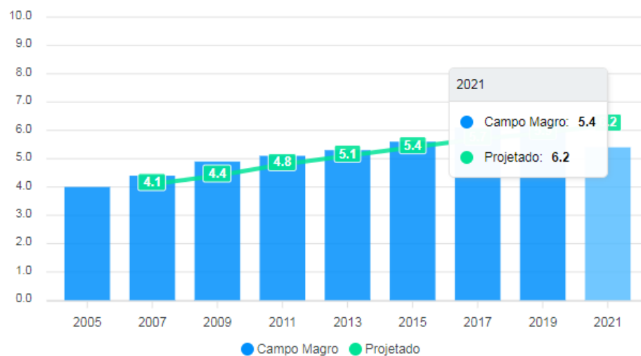
Evolução do IDEB